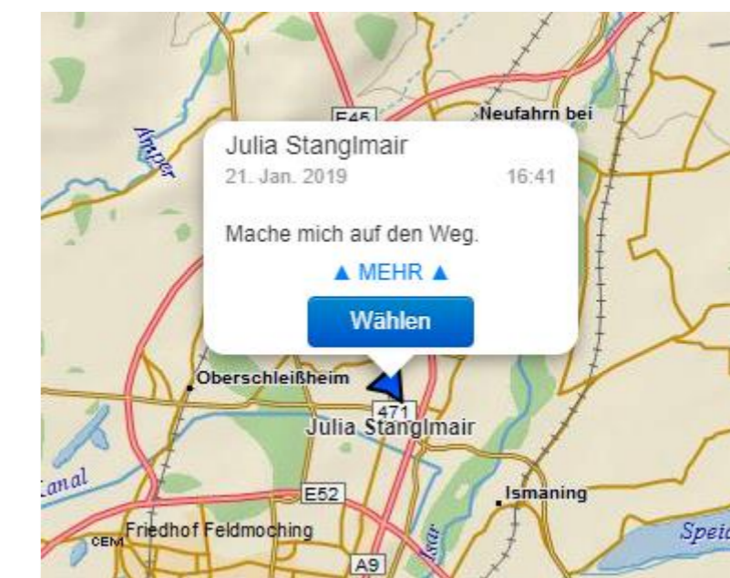
(5) Versand einer Nachricht mit inReach: Anzeige der aktuellen Position mit Nachricht